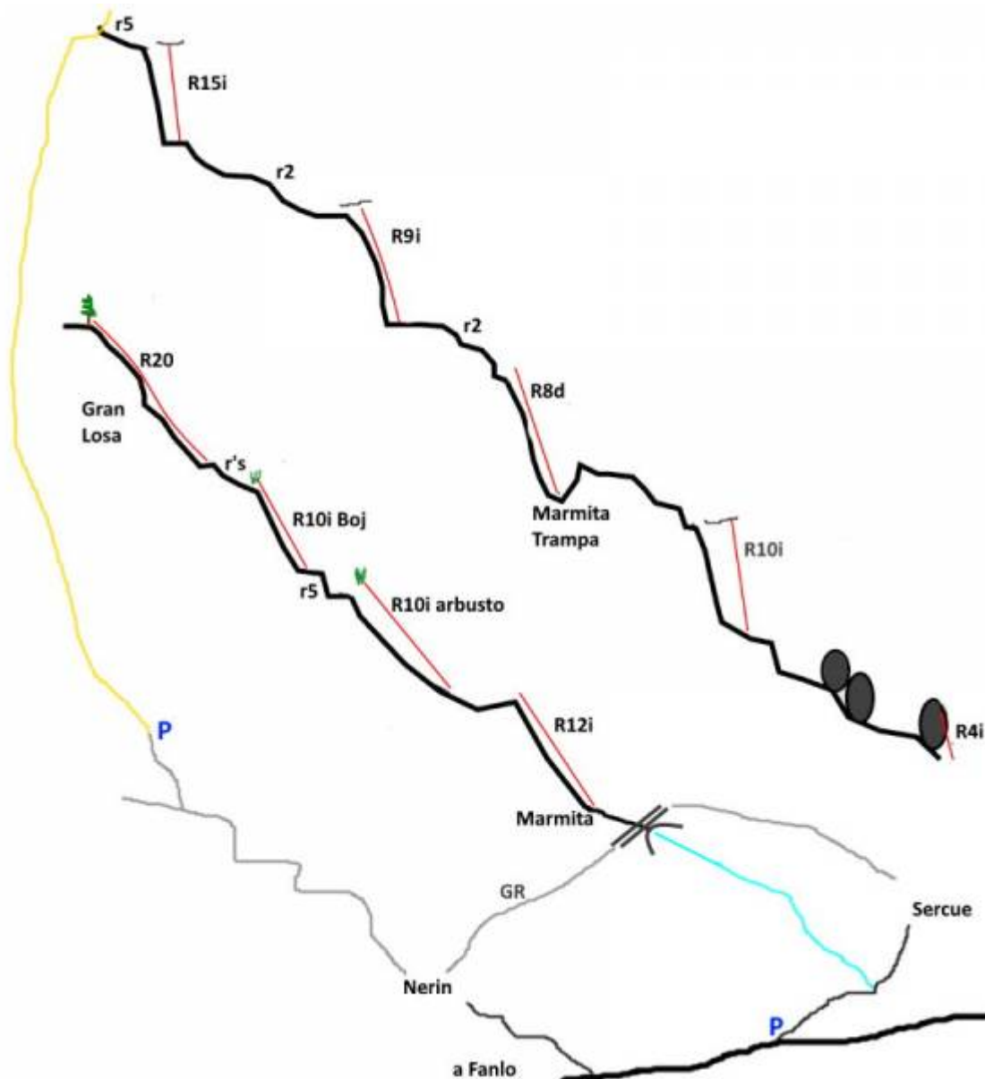
Topografía esquemática Ballatar