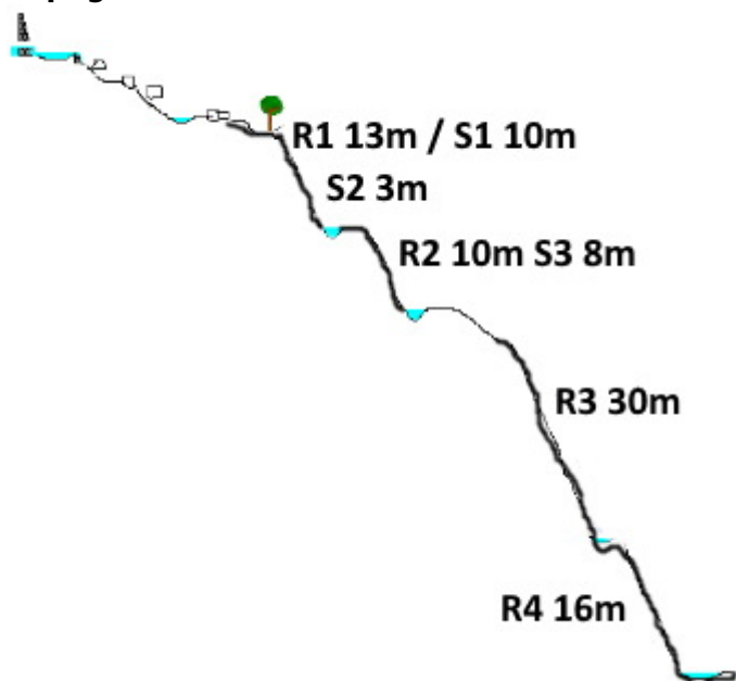
Imagen: Os Lucas Topo