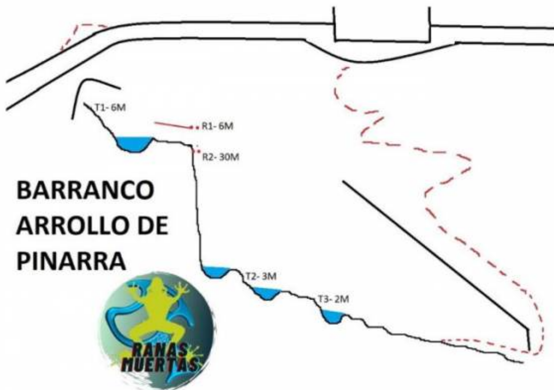
Imagen: ranas muertas