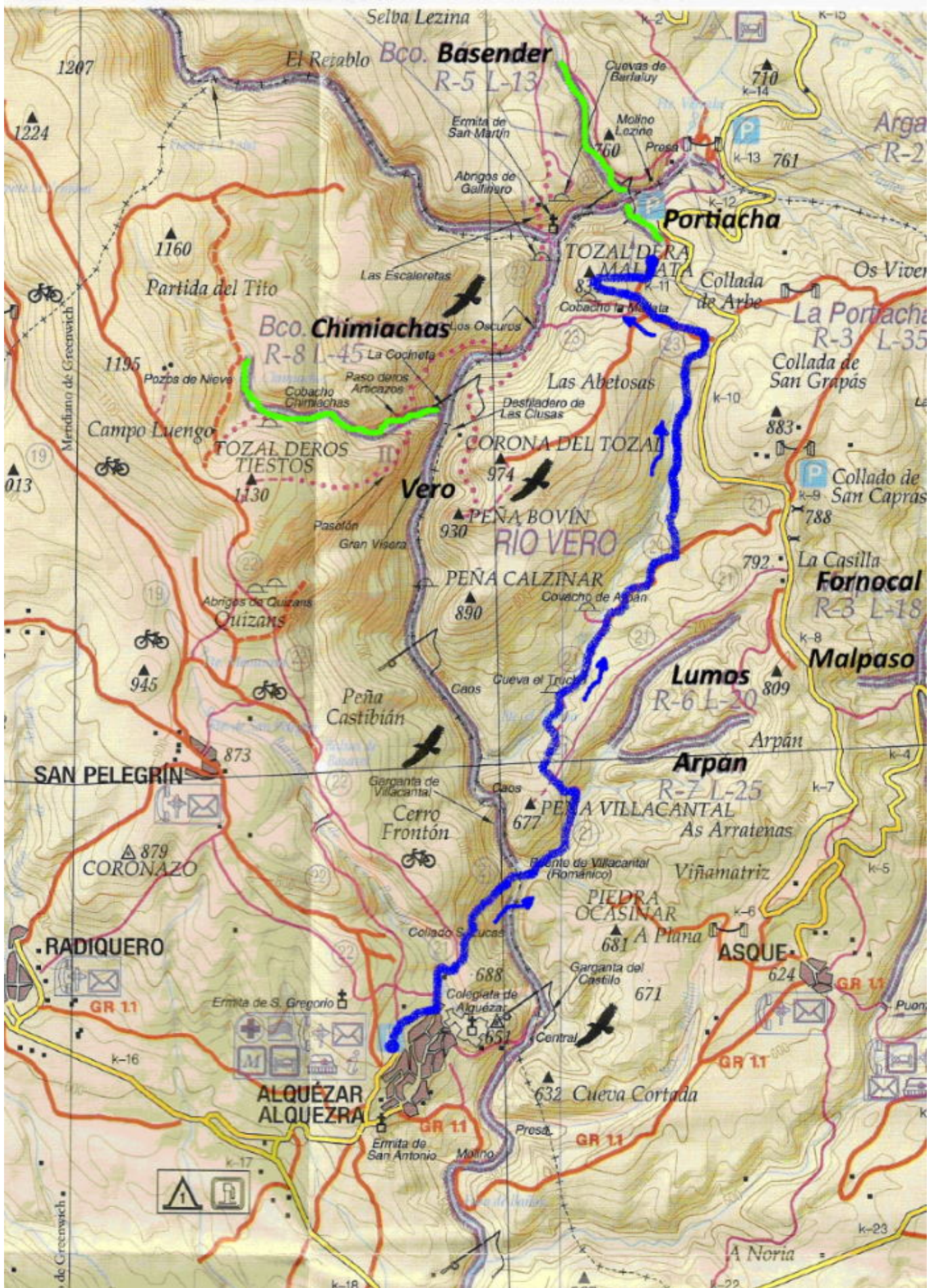
Imagen: Sector Vero