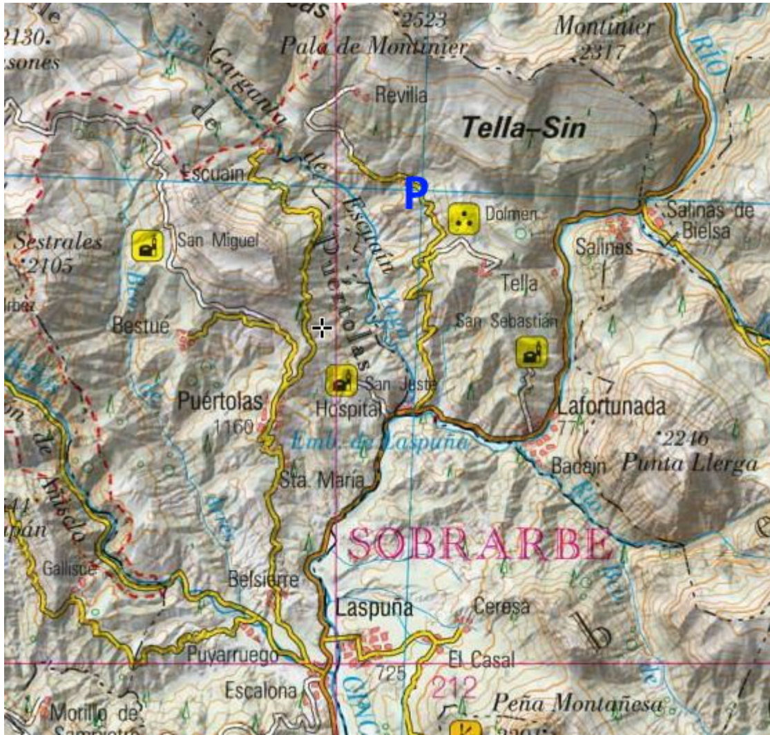
Situación Tránsito Inferior y Superior